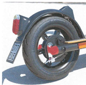
3 Bremssysteme & Profilbereifung

Über die Bedientasten aktivieren Sie den Frontscheinwerfer und das Rücklicht.