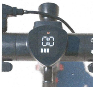
großes LCD-Display & Bedientasten

Energie-Rückgewinnung - das integrierte Rekuperations-System nutzt die Energie beim Bremsen oder Bergabfahren zum Laden des Akkus und sorgt so für mehr Reichweite.