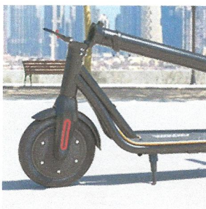
in Sekundenschnelle Transportbereit

entwickelt und designed in Deutschland. Für eine lange Laufleistung werden ausschließlich hochwertige aufeinander abgestimmte Bauteile verwendet.