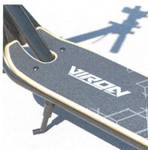
Design und Qualität - Viron Germany

So lassen sich zu fahrende Strecken, Navigation (GPS) oder Musik direkt vom Display ablesen bzw. einstellen.