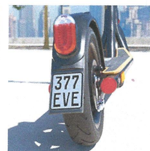
optional mit Plakette & Versicherung

Zu jeder Zeit - Der Leistungsstarke LED-Frontscheinwerfer sorgt für eine perfekte Ausleuchtung und eine weitreichende Sicht bei allen Lichtverhältnissen. Das LED-Rücklicht macht Sie auch in der Nacht gut sichtbar.