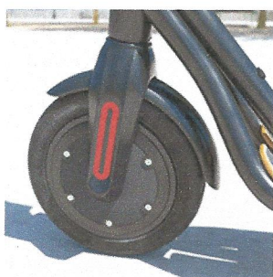
9.5" Zoll Räder & 500W Motor mit Rckuperation

Meistern Sie den Alltag - mit den großen 9,5 Zoll Rädern sind Sie auch auf Wald- und Pflasterwegen komfortabel unterwegs.